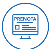
Booking Engine + Booking APP

Nella nuova versione grafica e migliorato nelle funzionalità. Un software calibrato dai nostri professionisti, per gestire al meglio i dati provenienti dalla strategia distributiva. Disponibile anche nella versione mobile per sito e pagina Facebook